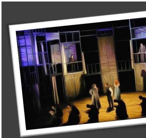
ЧЕТВЪРТА НАЦИОНАЛНА КОНФЕРЕНЦИЯ НА БДПГТ