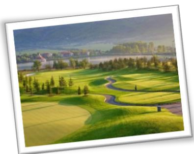
Изглед към прилежащият към хотела терен. Мястото е прекрасно както за провеждане на работни срещи, конференции и други форуми, така и за „бягство“ от градската среда