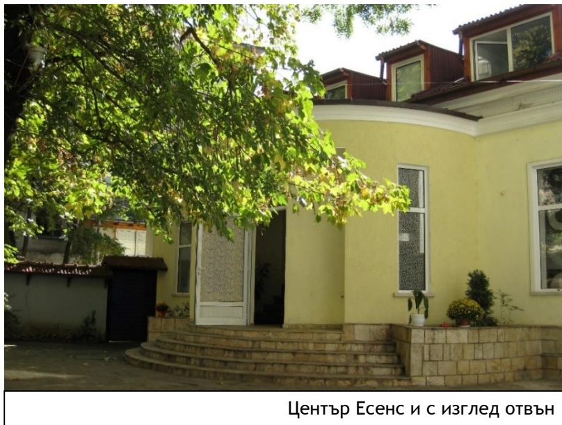
Център Есенс и с изглед отвън

Групата е съставена от колеги с различен опит и продължителност на работа.