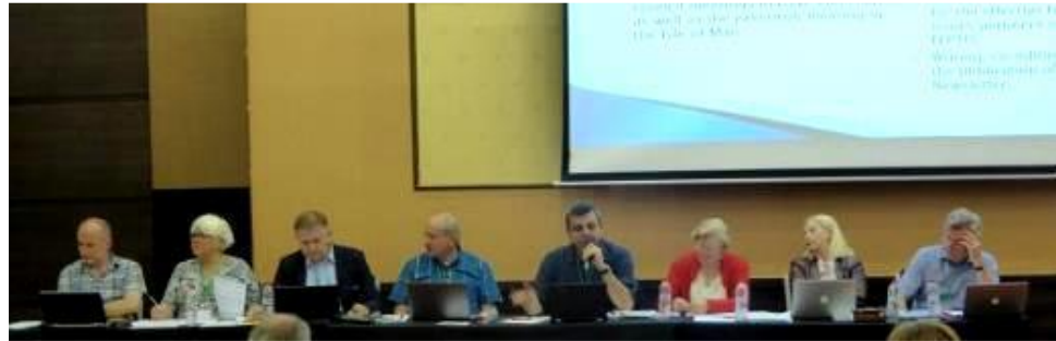
УС на FEPTO. В центъра Никос Такис, Президент на FEPTO

Ако желаете да публикувате информация за предстоящо събитие, може да се свържете с нас. Информацията се публикува по реда на постъпване. Запазваме си правото да откажем публикация ако тя противоречи на Устава на организацията или засяга нейният интерес и този на нейните членове